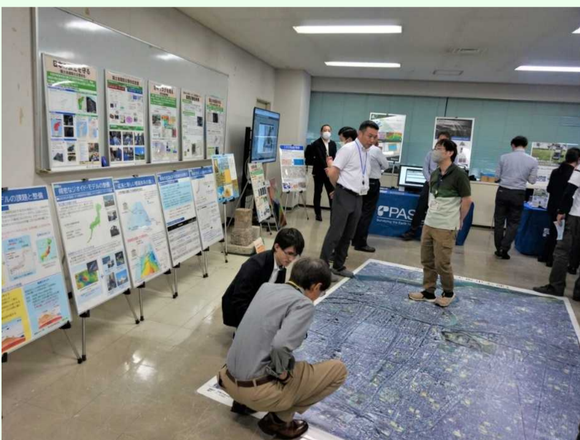
令和7年度のパネル展、測量機器・システム展の様子